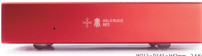
W212 x D143 x H42mm 2.4 Kg

Holo Audio RED 4562430951674 190,000 (税込) Holo Audio RED iCAT Tuned OS 200,000 (税込)