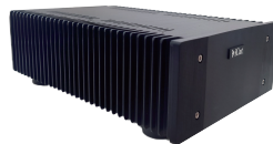
SRモデル用 リニア電源 Black or Silver