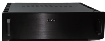
Black Model 筐体